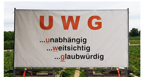
Dies ist der „gänzliche Verzicht auf jede Form der Plakatierung“ bei der UWG

Im Juni standen riesige Plakate der UWG an der Gudener Allee und an anderen Stellen im Stadtgebiet.